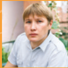
ДҮРТ ХИКӘЯ Сәер кеше