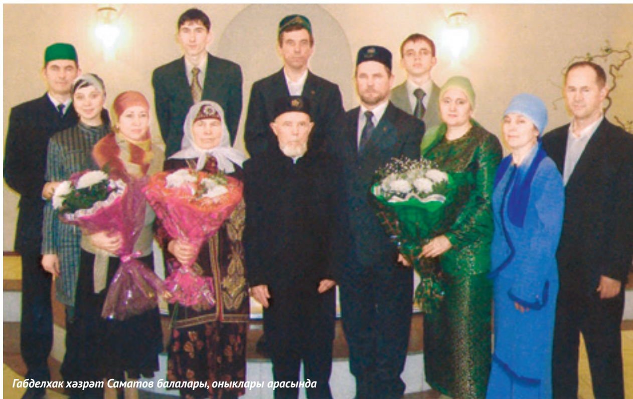
Габделхак хәзрәт Саматов балалары, оныклары арасында

«Дөньяда комсыз булма, сине Аллаһ яратыр, кешеләр кулындагыга кызыкма, сине халык яратыр», ди пәйгамбәребез (с.г.в.) үзенә хәдисендә. Бар булганына шөкер итеп, халкы өчен жан атып яшәгәнгәдер, күренекле мөселман эшлеклесе, Татарстанның баш мөхтәсибе һәм казые булган Габделхак хәзрәт Саматов та, арабыздан киткәнәнә шактый гомер узса да, күңелләрдә моңлы бер жыр булып яши. Әңгәмә корганда дин әһелләре дә, намазлы гади кешеләр дә мәшһүр казый турындагы хатирәләрне яңартмый калмый. Аның дингә тугрылыгы, бәлки, туган җире Аксубай районы белән дә бәйләдер. Ул яклар, Самара, Ульянов өлкәләре электән диндарлыгы белән аерылып торган бит. Хәер, ничек кенә булмасын, дини хезмәтенә генә түгел, тормыш юлына күз салсаң, үзен мөселман дип санаган һәркем шулай яшәргә омтылырга тиеш, дигән фикергә киләсең. Анда иманлыкты да, дин юлында куелган көч тә, фидакяр хезмәт тә, мәхәббәт тә, гаилә дә – һәммәбез өчен үрнәк булырлык. Мөхтәрәм хәзрәтнең олы кызы Фирдәвес ханым белән очрашып сөйләшкәч, әнә шундый нәтижә ясадым.