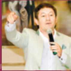
СӘХНӘ АРТЫНДА Башкортстан жырчылары гади...