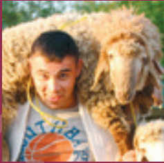
ИЖТИҤАД Яшәүче яшәргә тиеш!